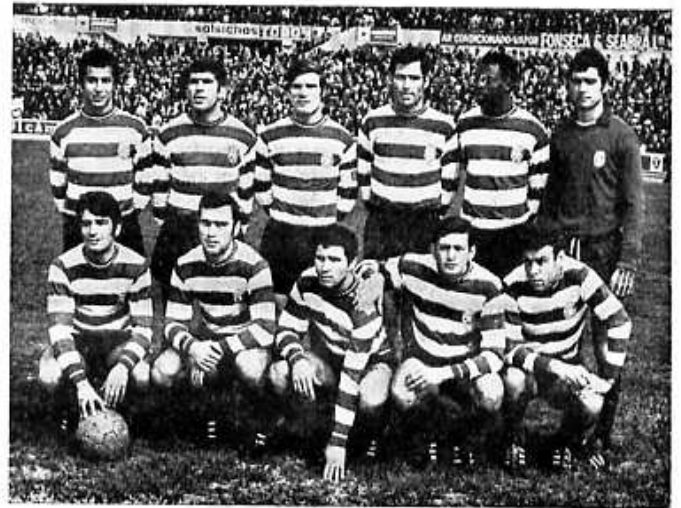
O VALOROSO CONJUNTO DO SPORTING CLUBE DE PORTUGAL

Também o nosso jornal «Horizonte» vem lançar a ideia dum campeonato entre as companhias cujo vencedor será galardoado com um troféu.