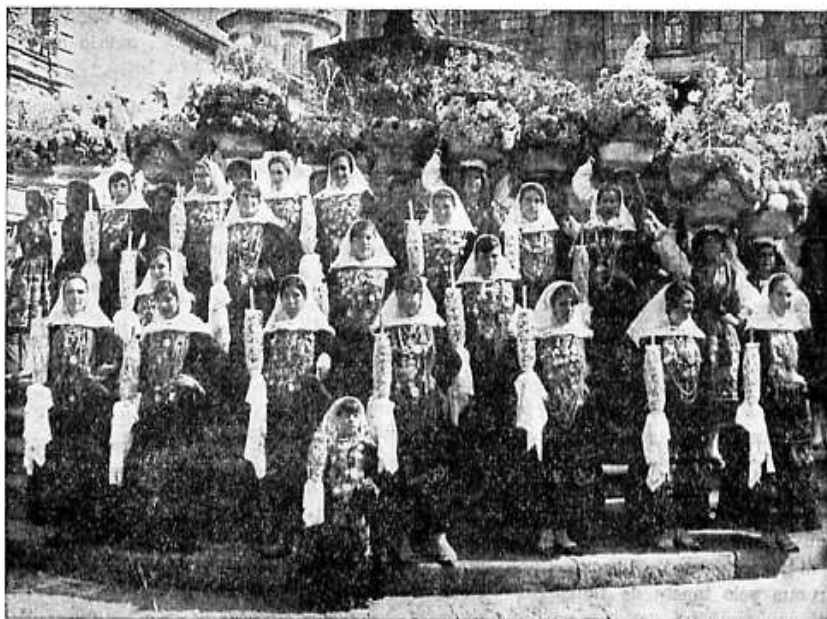
Rancho Folclórico de Santa Marta de Portuzelo