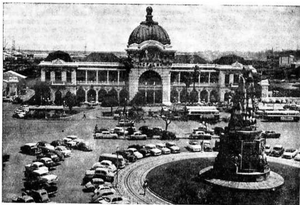
PRAÇA MAC MAHON — LOURENÇO MARQUES