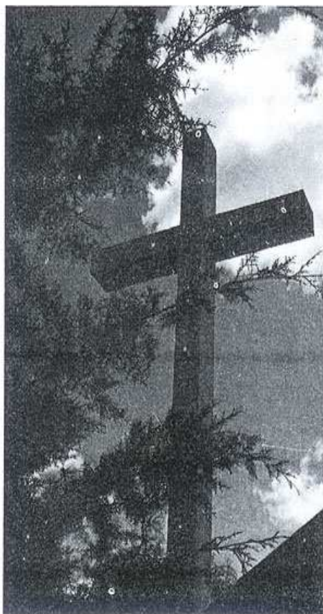
SACRIFÍCIO E SAUDADE