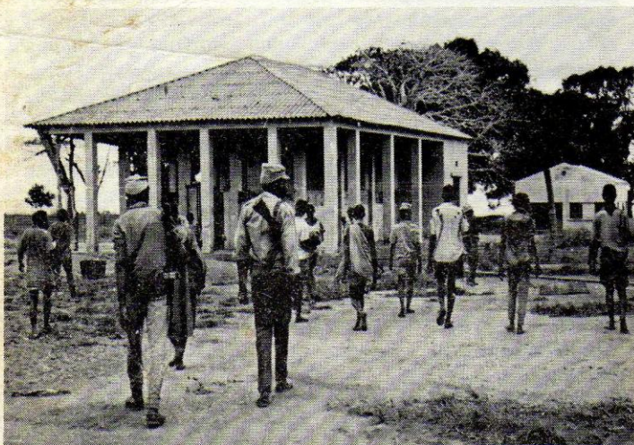
Guerrilheiros juntos com o povo, estão a entrar no posto de Muidumbe, depois de expulsarem a tropa portuguesa

Os colonialistas encontram-se na situação de um homem ro- deado de vários incendios, que corre apagar o fogo na direita para sentir logo intensificada a chama que se encontra à es- querda. Os colonialistas estão desnorteados: com a operação «Nó gordio» em 1970, pensavam apagar o fogo em Cabo Delgado, o fogo não se apagou em Cabo Delgado e o incendio até se estendeu a sul do Zambeze e do eixo Montepuez - Porto Amélia. Depois quiseram-se concentrar em Cahora Bassa para se aperceberem que os nossos combatentes tinham transfor- mado Cahora Bassa numa ilha, isolada do resto do país. Hoje, o inimigo português compreendeu a imensidade do seu fraca- sso, mas não pode aceitar a sua derrota.